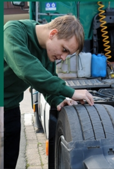
Wann wechsele ich wie die Reifen? Was ist der optimale Reifendruck? Reifencheck – wonach schaue ich? Warmmeldungen bei Druckverlust?

Voneinander füreinander lernen. Unsere langjährig-beschäftigten Fahrer kennen die besonderen Herausforderungen im Berufskraftverkehr. Es gibt da noch Dinge, die man in der Berufsschule nicht lernen kann. So geben unsere Fahrer den Azubis Erfahrungswissen weiter, das sehr nützlich ist, um Stresssituationen besser zu meistern.