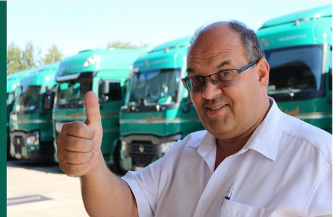
Unsere Fahrer und Fahrerinnen sind zusammen jeden Tag mehr als 15.000 km bundesweit unterwegs.

Wir kümmern uns um alle behördlichen Genehmigungen und stellen amtlich gültige Halteverbotszonen auf – so steht Ihnen nichts mehr im Wege!