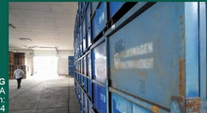
STAPELBERG Steinkamp 4 A Telefon: + 49 (0) 39 41-58 83 34