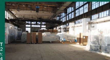
HALBERSTADT Rudolf-Diesel-Straße 52 Telefon: + 49 (0) 39 41-60 00 64