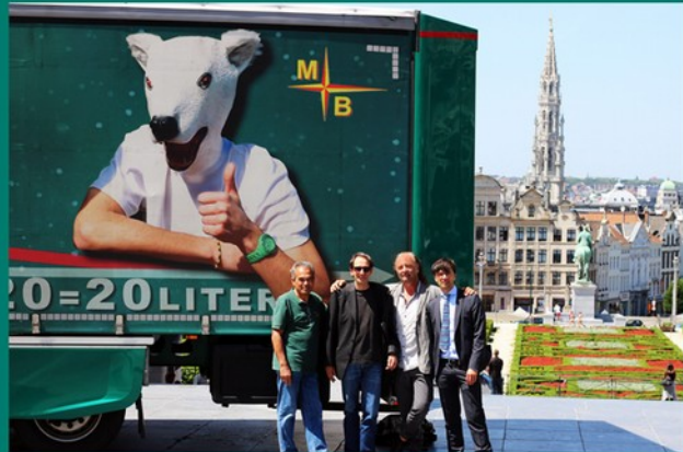
Unser Team bei der NGO "Transport & Environment" am 9. Juni in Brüssel

“Wir stellen euch unseren 9-Punkte-Plan vor, der zeigt, wie wir durch den gezielten Einsatz am Markt verfügbarer Technologien den Durchschnittsverbrauch unserer Zugmaschinen von 35 Liter auf ca. 25 Liter reduzieren konnten.”